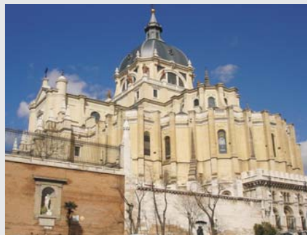
Cripta y Catedral de Santa María la Real de La Almdudena (Madrid), construida con materiales pétreos naturales.